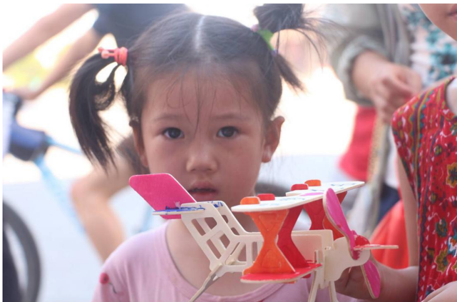
围观的小孩子注视着镜头

精美的手工创意品使过往的路人连声赞叹，驻足观赏。“大家看到的手工创意品的材料大多取自废弃物品，是我们和花石中学的同学们一起完成的。”志愿者在旁讲解道。手工作品吸引了众多小朋友和家长前来观看。小朋友询问作品制作材料和过程，志愿者们耐心的为其解答，鼓励他们在今后也可以利用废弃环保材料做些手工制品。用废弃筷子制作的相框在同学们的精心装饰下既美观又有使用价值。用纸箱板制作的孙悟空皮影惟妙惟肖，用树叶拼凑的人物也很有极具创造力。最后，在展览收尾前，学生们为观众们深情朗诵了一段精彩的《少年中国说》。