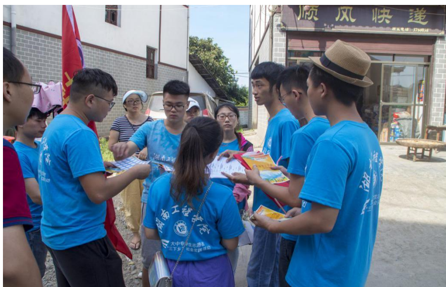
志愿者在分配宣传任务

“爷爷，您好！我们是湖南工程学院电气信息学院的学生，现在我们在进行暑期社会实践活动，您家里有什么坏掉的家电吗？我们在思蒙镇中心小学有电器义务维修活动，您可以拿来给我们修，不要钱的。”从最初的怀疑，到最后的热情邀请，志愿者们得到了村民的认可。