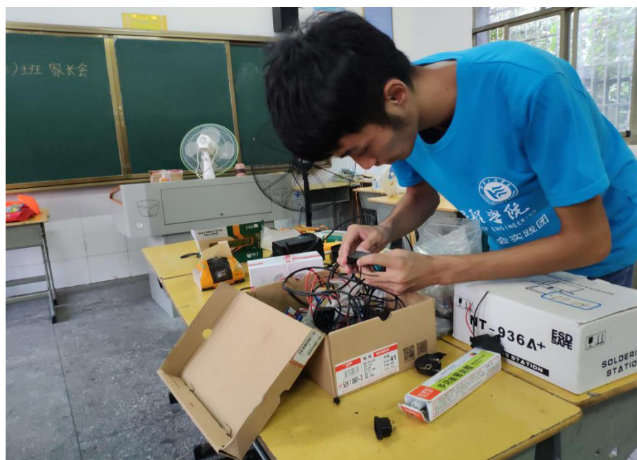
志愿者在准备维修用具

科技服务入乡村，义务维修系民情。湖南工程学院电气信息学院暑期社会实践团在怀化市溆浦县思蒙镇中心小学开展电器义务维修活动，旨在发挥专业优势与特长，为老百姓谋福利。