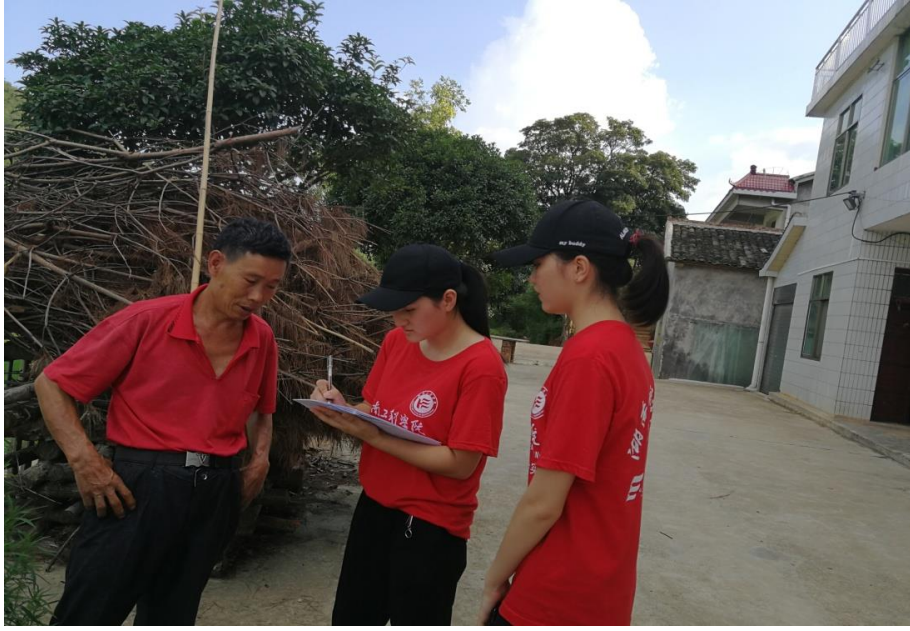
志愿者与村民共同填写调查问卷

大学生暑期“三下乡”社会实践是高校素质教育的有效载体,也是大学生锻炼自身综合素质、提高实践能力、更是展示当代大学生风采的最好平台。管理学院“三下乡”实践团成员们希望通过此次调研活动,能够深入了解农村宅基地使用现状以及空置房宅基地和住宅原因,利用自身专业知识,探讨农村宅基地退出与补偿模式,针对国家相关政策,提出合理意见,在促进自身发展的同时,为社会发展做出贡献。