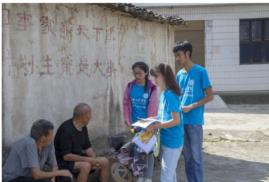
志愿者向村民宣传电器义务维修活动

“爷爷，您好！我们是湖南工程学院电气信息学院的学生，现在我们在进行暑期社会实践活动，您家里有什么坏掉的家电吗？我们在思蒙镇中心小学有电器义务维修活动，您可以拿来给我们修，不要钱的。”从最初的怀疑，到最后的热情邀请，志愿者们得到了村民的认可。