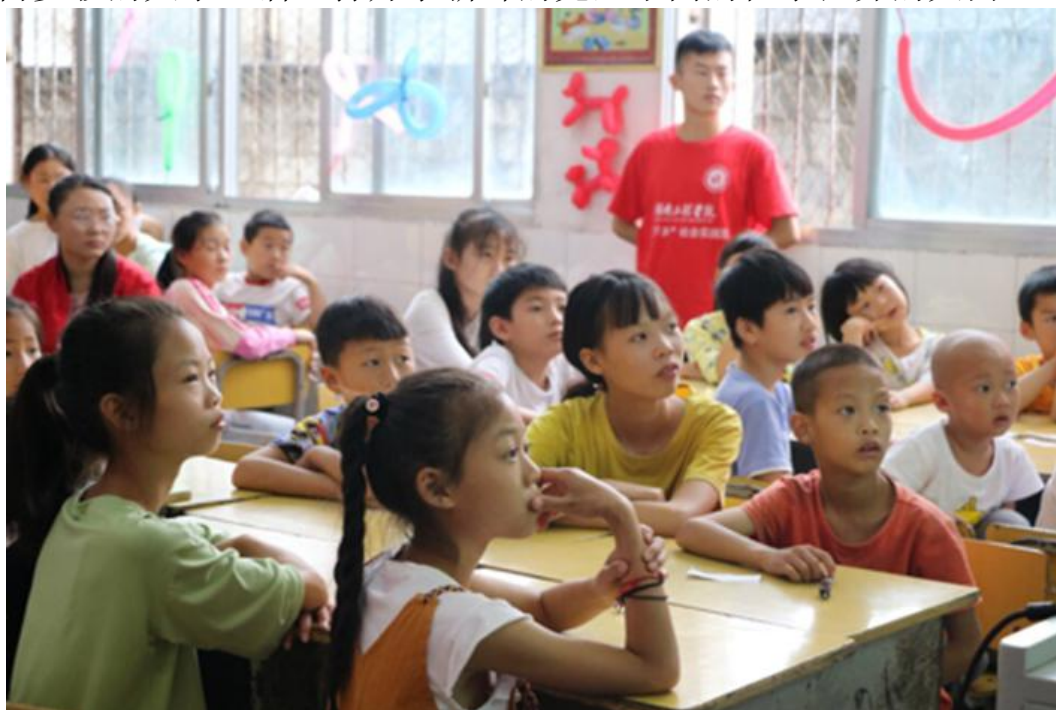
小朋友们认真听讲

在趣味的开班仪式上，小朋友们慢慢认识了志愿者老师，了解到了丰富多彩的大学生活，打开了新鲜的完全不同的化学世界的大门。