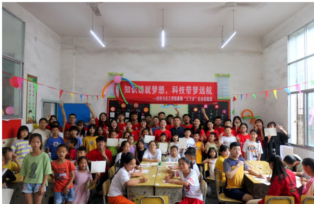
志愿者与孩子们合照

少年强则国强，孩子们是祖国未来的希望，而留守儿童作为一个特殊群体，更应该成为全社会关注的对象。当代青年更应该用自己的力量，给予他们更多的关心与陪伴。