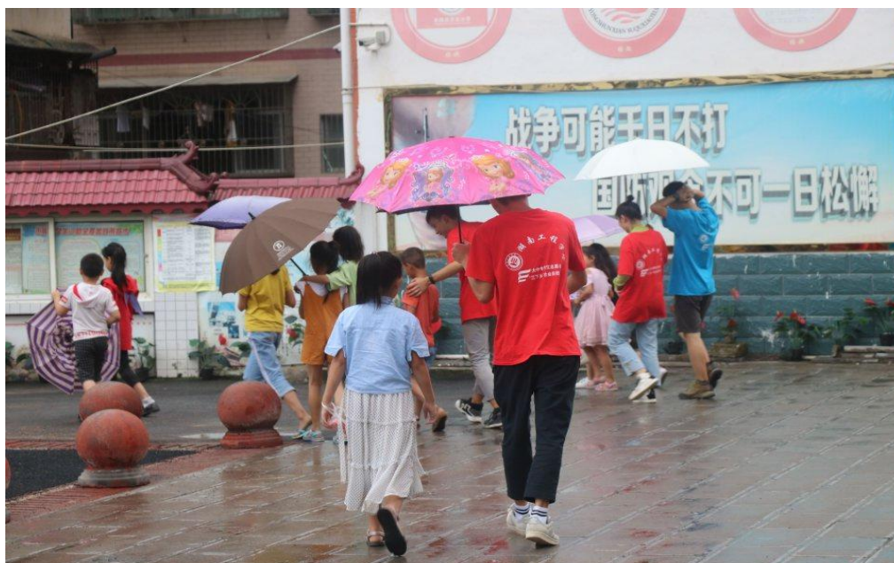
志愿者们送小朋友回家