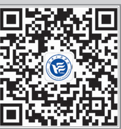
湖南工程學院 微信公众平台

一阵凉风吹过,我不由得瑟缩了一下,抬头看一下天空,所代替的只有阴沉和暗无天际的夜,我经不住想起了另一个夜,有凉风,却没有这样的阴沉与昏暗。月光如水,像水一样轻轻的流淌着。