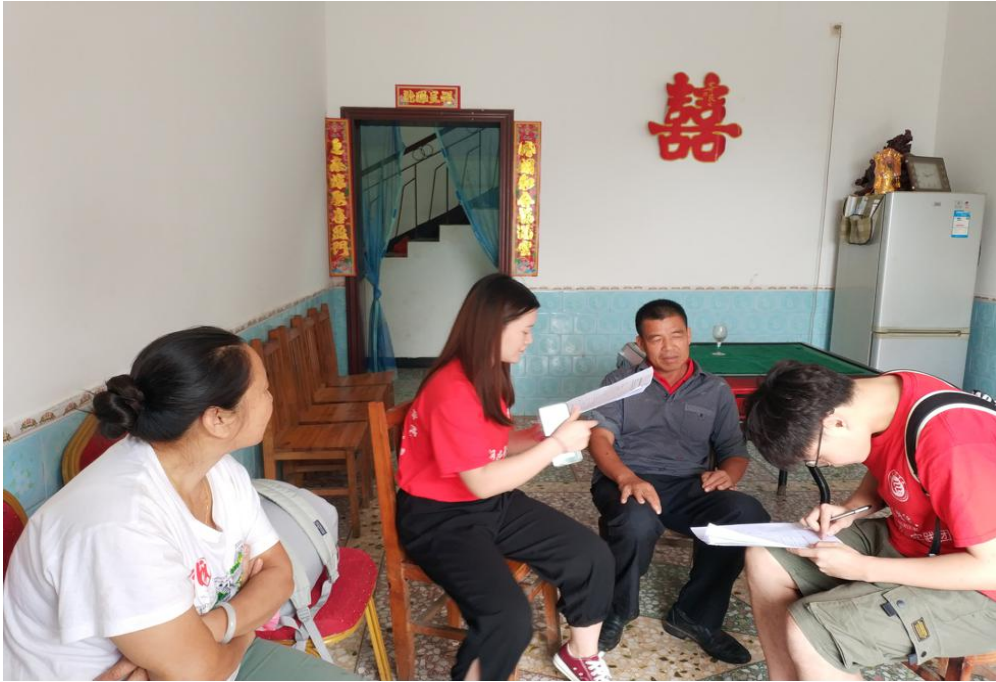
管理学院、经济学院同学在村民家交流谈话

大学生走出校园，深入农村，不仅是付出的过程，更是收获的过程。大学生接受优胜的教育，习惯生活在象牙塔里，会淡化对外界的困难意识。大学生大多没有吃过什么苦，从小娇生惯养，没有经历过生活的磨练，缺少吃苦耐劳的精神。“三下乡”可以走进社会底层去历练、去锻造，磨砺自我。下乡调研，并不是意味着让他们填好调查问卷就足够了，而是意味着要去跋山涉水，要了解乡下民情。“三下乡”对大学生的德智体、社会交际能力等综合素质都是一种锻炼与提高。