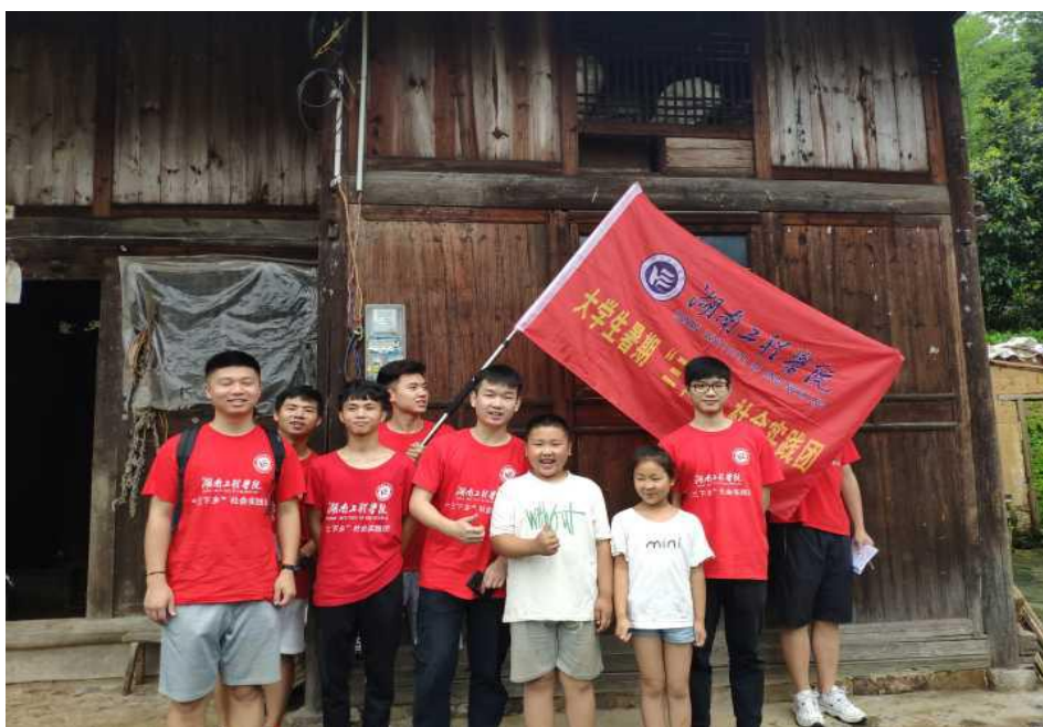
扶贫调研组与村民合影留念

存在部分切实需要帮助的贫困户没有得到足够帮助的现象。针对当地居民的反馈，扶贫调研组决定在接下来调研过程中，结合实际进一步深入了解村民情况，切实做到实地调查和真实反馈，为晃州镇的农村发展和脱贫建设贡献力量。