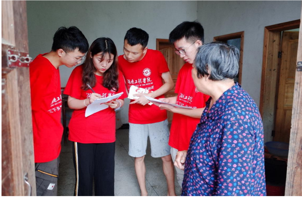
“知艾防艾传递青春正能量”走访村民

在本次暑期“三下乡”社会实践的乡村走访活动中，团队的成员们也都对活动进行了总结，对“知艾防艾，青春传递正能量”的主题有了更进一步的理解，也懂得了如何与他人进行更好的交流。迎着骄阳，踏上阳光大道，“三下乡”社会实践活动正昂首前进。