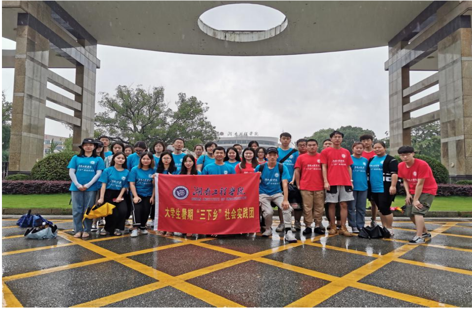
管理学院、经济学院老师同学集合留影

“三下乡”队员们同该村的老党员、老人一起拉家常，和留守儿童一起做游戏。村民们对实践团队员也非常热情，交流活动至始至终传递着一股正能量。队员们把准备好的书包、笔记本、文具亲手送到留守儿童的手中，孩子们的脸上洋溢着幸福的笑容。队员们和孩子们一起玩拼图绘画游戏，欢快的笑声弥漫整个活动室。游戏之余，队员们还向他们分享了自己的成长经历和大学生活。小朋友们纷纷瞪大了眼睛，好奇地聆听这些“新鲜事”。队员们鼓励这些孩子，要好好学习，天天向上，做一个对社会有贡献的人。