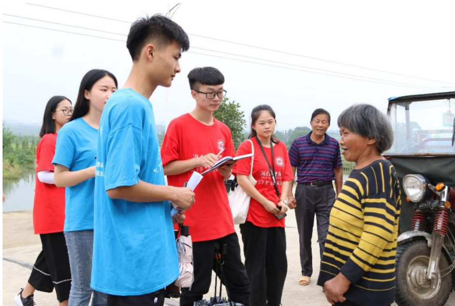
实践团进行实地调研