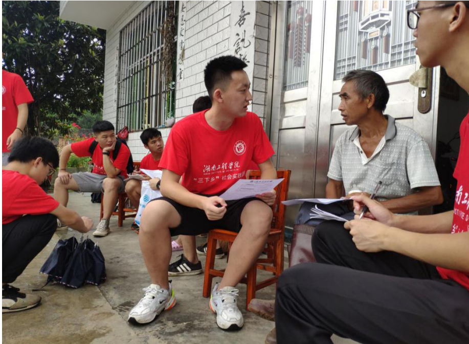
扶贫调研组成员走访贫困家庭

7月8日，教育关爱服务团扶贫调研组以方家屯完全小学为起点，对周边贫困家庭进行走访，实地调研怀化市新晃县晃州镇贫困家庭的情况。