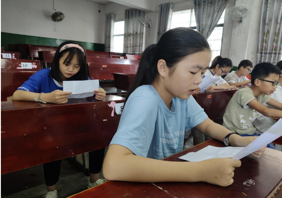
学生们在认真学唱歌曲

此次“感恩”主题的音乐课，有利于加强对学生的德育教化，为他们塑造懂得感恩，心怀善良的人格奠定了一定基础，也对他们将来的成长起了一定积极的影响。