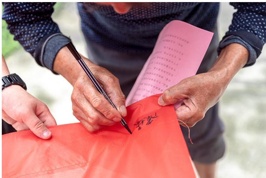
当地村民听取实践团政策宣讲后在横幅上签字

在后续的工作中，实践团还将通过一系列的基层调研、实际体验等方式，进一步结合当地特色、民意、市场动向等实际情况进行最终的设计定稿。