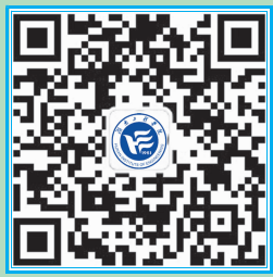
湖南工程学院 微信公众平台