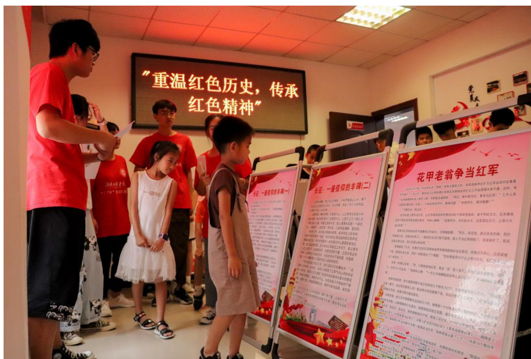
在实践团的带领下阅读红色长廊

“重温红色历史，传承红色精神”盘龙社区红色教育宣传活动圆满结束，活动从整体上让更多的小朋友了解红色文化、红色精神，将红色的种子种进小朋友的心里。