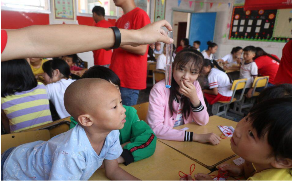
孩子们认真观看实验现象

走马灯是传统节日玩具之一，属于灯笼的一种，在酸雨小实验之后，志愿者带小朋友们进行了走马灯的制作。同组的小朋友分工合作，在纸上画出了自己喜欢的各种图案，每一步，认真而谨慎。最后，共同制造出了成品。“老师，走马灯为什么会转呢？”，在得到回答后，小朋友们茅塞顿开。“老师，你们可真厉害！”略带童真的语气中，满满的都是崇拜与喜爱。