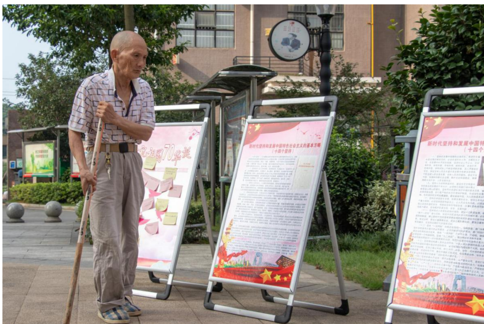
居民阅读红色长廊

洋溢、满面笑容的舞蹈表演《吉祥》、同学们激情饱满的大合唱《在灿烂阳光下》足以体现革命的成功。随着社会主义事业一步步地建设，如今人们的生活水平已经有了质的飞跃，人民的温饱问题已经全部解决，在过好日子的同时可以发展自己的业余爱好。我们今天在灿烂阳光下成长是当年无数的爱国者用生命换来的，我们应当勿忘祖国的艰难历史，牢记使命为新时代的中国特设社会主义事业建设付出自己的力量。