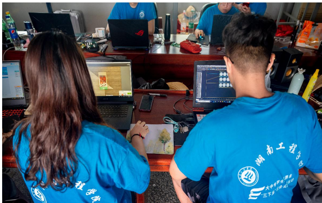
志愿者正在为农产品设计包装

绿水青山就是金山银山，我校设计艺术学院设计专业学生深入践行习近平总书记的这句话，他们组成的“送设计下乡”团队以“艺术介入乡建”的方式，通过实地走访调查泉塘镇蔬菜产业基地，对各类农产品进行详细分析，讨论方案，为当地农产品进行包装设计。志愿者结合专业知识，抓住农产品包装的核心价值，环保、保鲜、直观的其设计了一系列的外包装。结合当下热销农产品如：辣椒、甜瓜、水果南瓜等，在设计思维的表达上大胆创新，采用管式折叠飞机盒、盘式折叠飞机盒、管盘式折叠飞机盒等不同形式和不同材质的外包装，遵循“人与自然”“看得见”的理念，为农产品赋能。据了解，农产品包装设计工作已经形成了 10 多份设计初稿，在三下乡实践活动结束后进入后期设计，通过指导老师及当地农产品负责人的指导及建议，进行最终的设计定稿，为当地农业发展做出理念贡献。